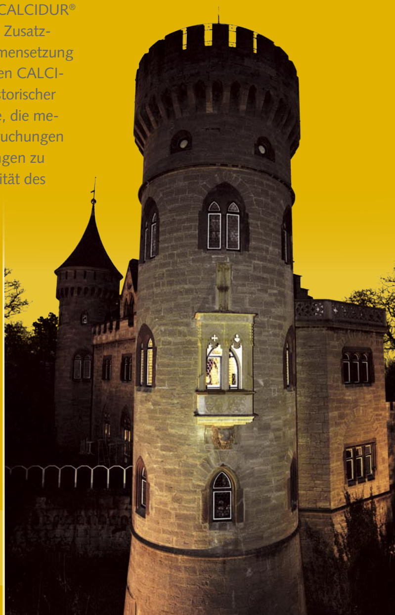
Schloss Landsberg, Meiningen